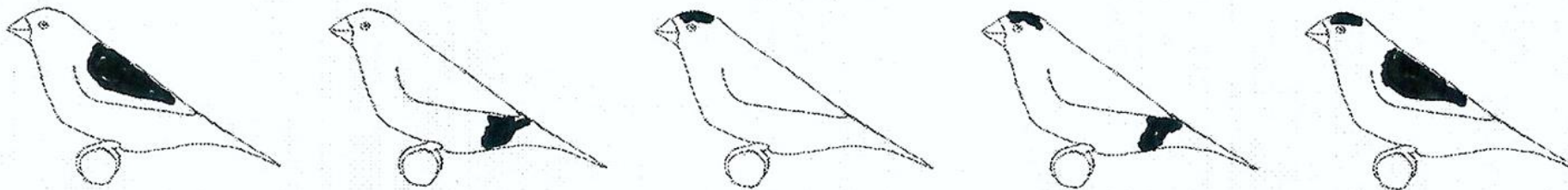
Enige voorbeelden van getekende met overige getekende bont patroon.