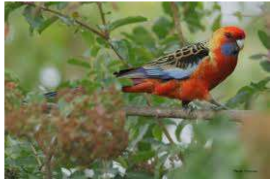
Afbeelding en foto: Rien Steenbakkers