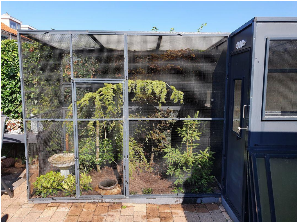
Volière met aangebouwd nachthok.

Als regel is een tocht en vorstvrij nachthok aan een dergelijke vlucht gekoppeld.