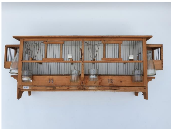
kooi uit de verzameling van de Culturele Vogelhouderij.

Dhr. A Bartels was in het midden van de 20 e eeuw zangkanarie fokker en keurmeester. Vanuit zijn praktijkervaring met het fokken van zangkanaries ontwikkelde hij een voor dat doel zeer geschikte dubbele broedkooi.