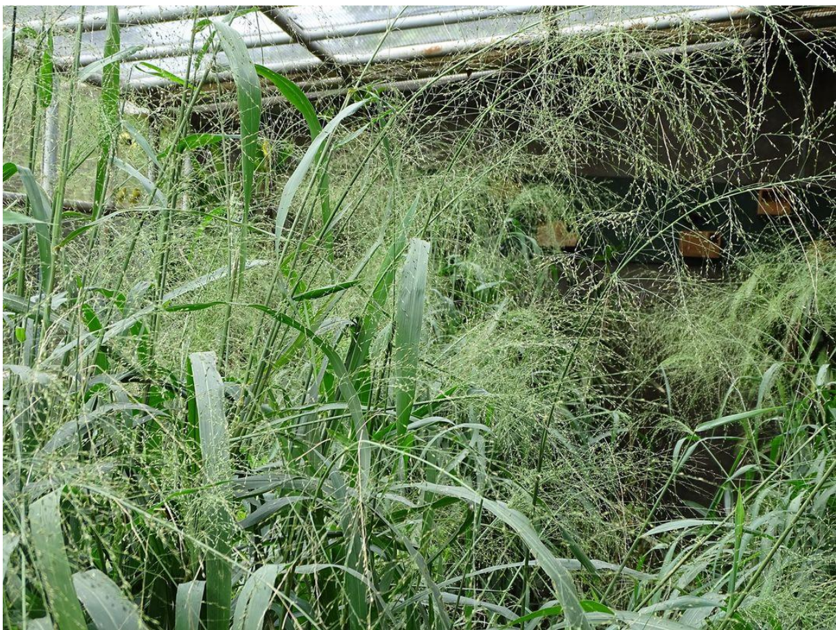
Voorbeeld van de beplanting van een volière voor Prachtvinken

Geslacht Padda, grootte 13,5 – 15 cm. 2 soorten Rijstvogels.